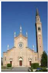
SAN ROMANO martire NEGRISIA