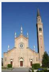
SAN ROMANO martire NEGRISIA