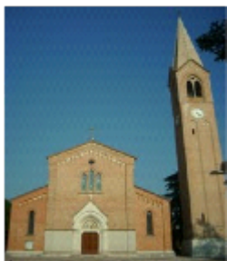
SANTA FOSCA VERGINE E MARTIRE RONCADELLE