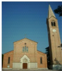
SANTA FOSCA VERGINE E MARTIRE RONCADELLE