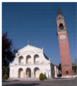
SAN BARTOLOMEO APOSTOLO ORMELLE