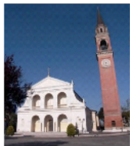
SAN BARTOLOMEO APOSTOLO ORMELLE

Tutte queste parole - e la loro chiamata ad essere messe in pratica - provocano Gesù a rispondervi e a riconoscervi tutto il suo programma e la sua missione. Gesù vivrà la sua vita umana, insegnerà, farà miracoli, morirà in croce e risorgerà per portare ai poveri, come consacrato del Signore («Cristo»), il lieto annuncio, per liberare i prigionieri e i ciechi, per sciogliere gli oppressi e per realizzare l'anno di grazia del Signore. Il nostro oggi, allora, deve diventare quello di Gesù, per liberarci dall'egoismo umano.