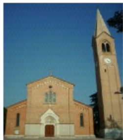
SANTA FOSCA VERGINE E MARTIRE RONCADELLE