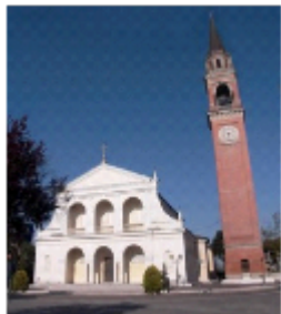
SAN BARTOLOMEO APOSTOLO ORMELLE