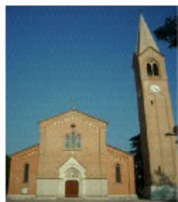
SANTA FOSCA VERGINE E MARTIRE RONCADELLE