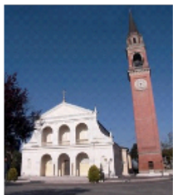
SAN BARTOLOMEO APOSTOLO ORMELLES