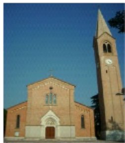
SANTA FOSCA VERGINE E MARTIRE RONCADELLE