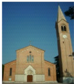
SANTA FOSCA VERGINE E MARTIRE RONCADELLE