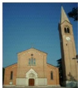
SANTA FOSCA VERGINE E MARTIRE RONCADELLE