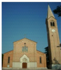
SANTA FOSCA VERGINE E MARTIRE RONCADELLE