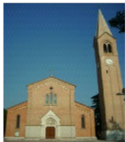
SANTA FOSCA VERGINE E MARTIRE RONCADELLE