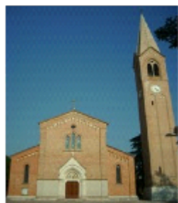
SANTA FOSCA VERGINE E MARTIRE RONCADELLE