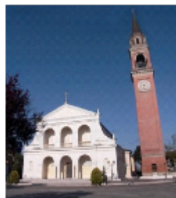
SAN BARTOLOMEO APOSTOLO ORMELLE