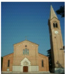
SANTA FOSCA VERGINE E MARTIRE RONCADELLE