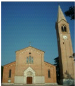
SANTA FOSCA VERGINE E MARTIRE RONCADELLE

Signore Gesù mi sono seduto e ho calcolato bene che non ho i mezzi umani per portare a termine l'impresa della salvezza della mia anima; ho esaminato bene che non posso da solo affrontare un nemico così potente e guadagnarmi il Regno dei Cieli. Maestro mi riconosco peccatore, pieno di autosufficienza, di interessi egoistici e soprattutto povero d'Amore... per questo ti chiedo la Grazia di farmi tuo vero discepolo... abbi Misericordia di me.