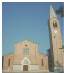
SANTA FOSCA VERGINE E MARTIRE RONCADELLE