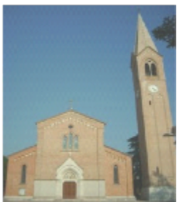
SANTA FOSCA VERGINE E MARTIRE RONCADELLE